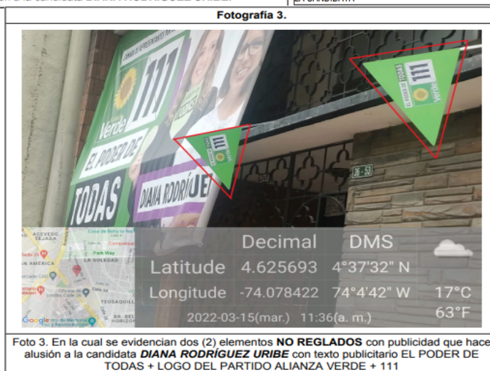
Foto 3. En la cual se evidencian dos (2) elementos NO REGLADOS con publicidad que hace alusión a la candidata DIANA RODRÍGUEZ URIBE con texto publicitario EL PODER DE TODAS + LOGO DEL PARTIDO ALIANZA VERDE + 111