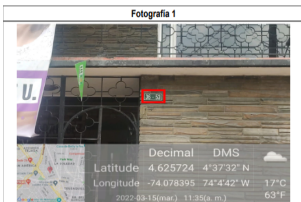
En la foto1 se identifica la nomenclatura del predio ubicado en la TV 28 B No. 36 - 53 , donde se encuentra ubicado un (1) elemento tipo aviso en fachada y dos (2) elementos no regulados haciendo alusión a la candidata DIANA RODRÍGUEZ URIBE .