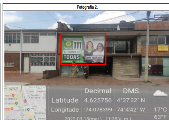
Foto 2. En la cual se evidencia un (1) aviso publicitario tipo aviso fachada que hace alusión a la candidata DIANA RODRÍGUEZ URIBE con texto publicitario CÁMARA DE REPRESENTANTES POR BOGOTÁ + LOGO PARTIDO ALIANZA VERDE + 111+ EL PODER DE TODAS +DIANA RODRÍGUEZ+ REDES SOCIALES DE LA CANDIDATA